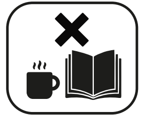
KEIN GETRÄNKE- UND MAGAZINSERVICE